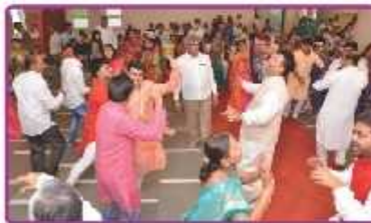
ગરબા રાસ રમતા ભાવિકો