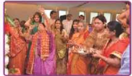
આશિશો આપતા ભોઈમા