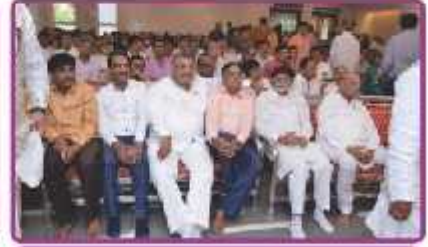
મહાનુભાવો સાથે ભાવિકો