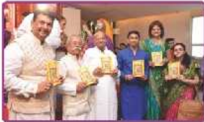
'હુકમ ધણીજી' પુસ્તીકાનું વિમોચન (વિખાબન અને ગ્રીતમ ખેવરી મોમાયા સંપાદિત)