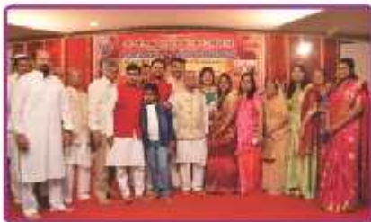
બારમી સમુહ પહેડીનાં ઢાતા પરિવાર