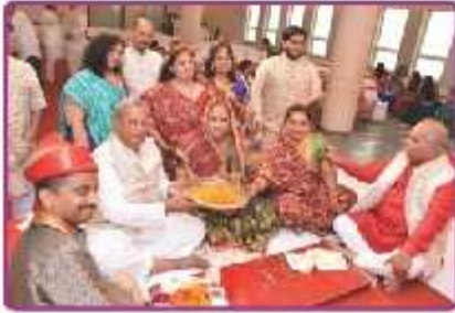
ગણેશ સ્થાપના કરતા લાભાર્થી પરિવાર