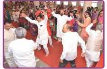
ગરબા રાસ રમતા ભાવિકો