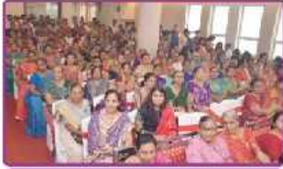
મોમાઈ ભક્તો તથા મહેમાનો