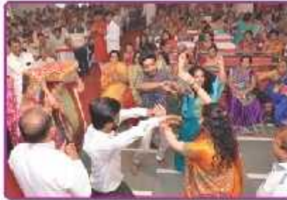
ચુંદડી ચડાવવા જતા લાભાર્થી પરિવાર