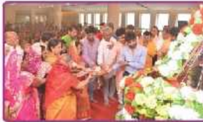
રામાધીરની આરતીના લાભાર્થી પરિવાર