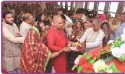
મોમાઈ માતાજીની આરતીના લાભાર્થી પરિવાર