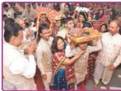
પહેડી મસાદ માતાજીને ધરાવવા જતા લાભાર્થી પરિવાર