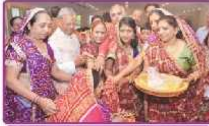
ભોઈમાને મુંડડી પહેરાવતા લાભાર્થી પરિવાર