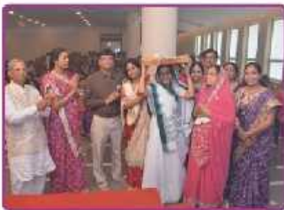
છત્ર ચડાવવા જતા લાભાર્થી પરિવાર