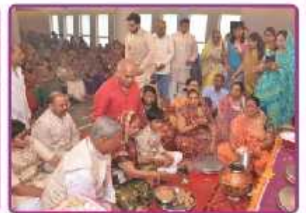
પહેડી મસાદ માતાજીને જુહારતા લાભાર્થી પરિવાર