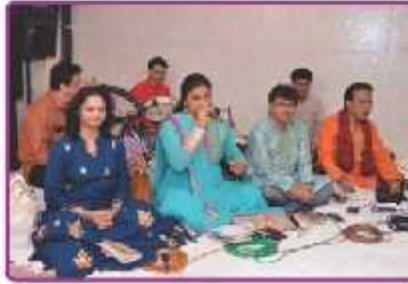
ભક્તિ આસાની એન્ડ સંગીત પાર્ટી