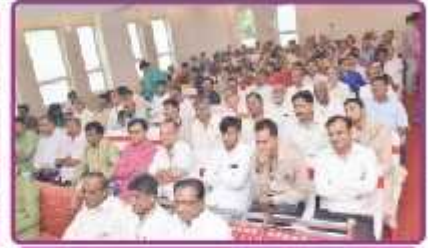
મોમાઈ ભક્તો તથા મહેમાનો