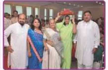
કુલહાર ચડાવવા જતા લાભાર્થી પરિવાર