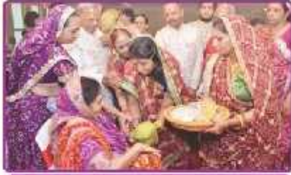
ભોઈમાને ખોળો ભરાવતા લાભાર્થી પરિવાર