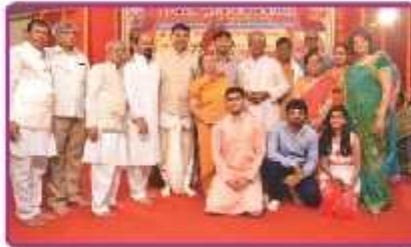
અગ્નીવારમી સમુહ, પહેડીના ઢાતા પરિવાર